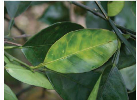
La figura 2