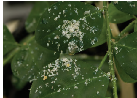
La figura 4

3. Insecto Asociado: El psílido asiático de los cítricos ( Diaphorina citri ) es el insecto más estrechamente asociado con la transmisión del enverdecimiento de los cítricos. La figura 4 muestra a las ninfas y la figura 5, a los adultos.