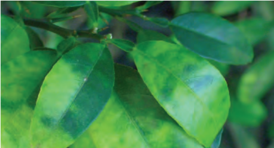
La figura 1

1. Follaje: Los primeros síntomas son hojas pequeñas y amarillentas en una rama o sección de la copa del árbol. Los síntomas más característicos del enverdecimiento de los cítricos son los moteadas asimétricos en las hojas llenas (fig. 1) y amarillamiento de las hojas (fig. 2). Otros síntomas son el amarillamiento