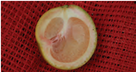
La figura 3

2. Fruta: Las frutas son pequeñas, descoloradas y/o asimétricas (fig. 3). Las frutas de los árboles afectados por el enverdecimiento de los cítricos tienen un sabor más amargo, medicinal y agrio. Las semillas generalmente se atrofian y la formación de la fruta es deficiente. Los síntomas varían según el momento de la infección, la etapa de la enfermedad, la especie del árbol y la madurez del árbol.