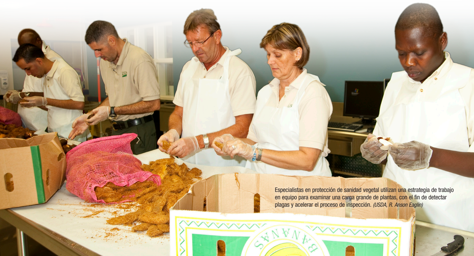
Especialistas en protección de sanidad vegetal utilizan una estrategia de trabajo en equipo para examinar una carga grande de plantas, con el fin de detectar plagas y acelerar el proceso de inspección.

Puede solicitar los permisos y recibirlos por Internet a través del sistema ePermits del USDA. La página electrónica proporciona un lugar único donde el importador puede ver y administrar todas las solicitudes, los permisos y otra correspondencia relacionada con la solicitud. Asimismo, el sistema permite a los funcionarios federales emitir, rastrear y verificar rápidamente los permisos de importación. Para obtener más información acerca de ePermits, visite www.aphis.usda.gov/aphis/permits .