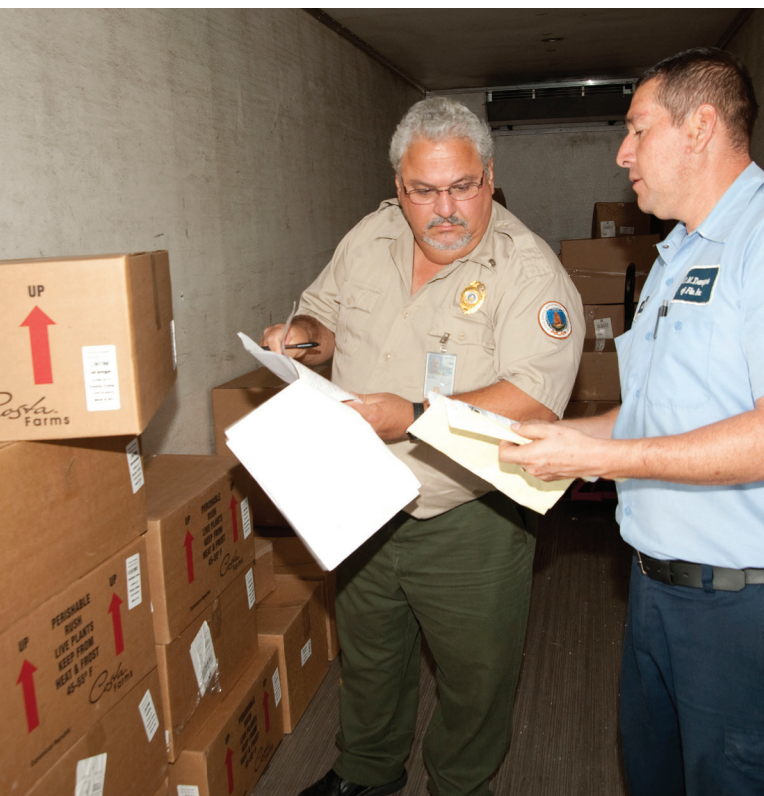
Un especialista en protección de sanidad vegetal revisa los documentos requeridos para la importación antes de la inspección.

Las estaciones de inspección de plantas tienen muchas funciones e incorporan varias disciplinas para promover el comercio internacional y proteger los mercados. Cumplir con esta compleja misión de protección comienza con un personal altamente entrenado, además del uso de métodos probados a través del tiempo y tecnología de vanguardia. El personal de las estaciones de inspección de plantas trabaja de manera activa