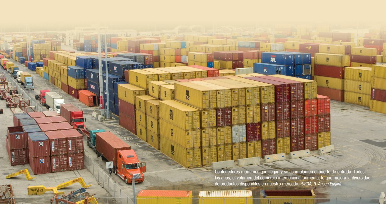
Contenedores marítimos que llegan y se acumulan en el puerto de entrada. Todos los años, el volumen del comercio internacional aumenta, lo que mejora la diversidad de productos disponibles en nuestro mercado.

Un brote de una sola plaga o enfermedad de una planta exótica puede tener un impacto devastador en nuestra fuente de alimentos y nuestros recursos naturales. Incluso un pequeño incidente puede tener una reacción en cadena y producir un aumento en los precios de los productos agrícolas. Las estaciones de inspección de plantas del USDA, localizadas cerca o dentro de los principales aeropuertos, puertos y fronteras internacionales de EE. UU. son una gran línea de defensa en la lucha contra plagas y enfermedades invasivas.